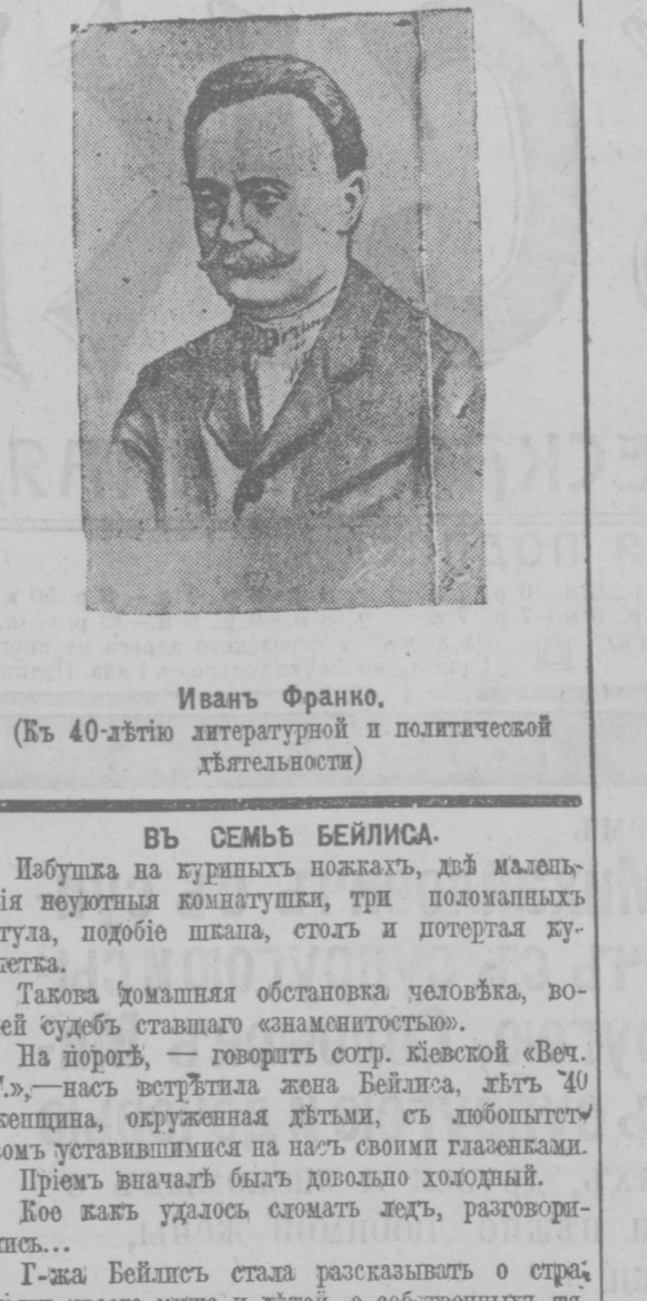
Иванъ Франко, бывшій политическій и литературный деятель.

Иль Польской жизни. Иль Польская жизнь, романъ известного писателя. Онъ рассказываетъ о жизни простых людей в Польше, о их трудностях, надеждахъ и мечтахъ. Романъ написанъ реалистично и эмоционально, что делаетъ его популярнымъ произведениемъ. Авторъ тонко передаетъ атмосферу жизни в то время и показываетъ глубину человеческих чувствъ.