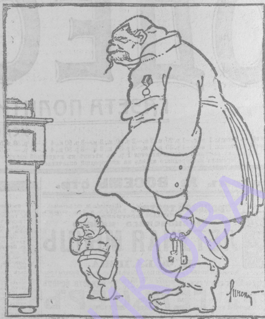
— Довольно доложить этот арестант все глбеть цдыловаться и просят к мам...