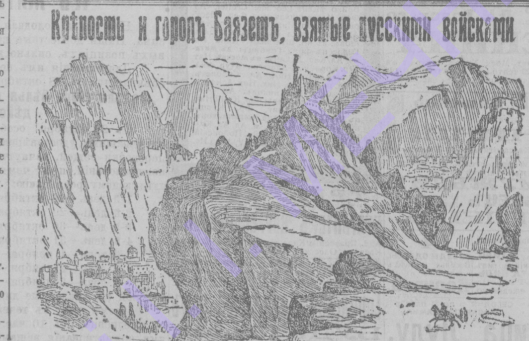
Крепость и городъ Баязетъ, взятые русскими войсками.