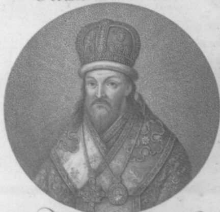
Святый Димитрій Митр. Рост.