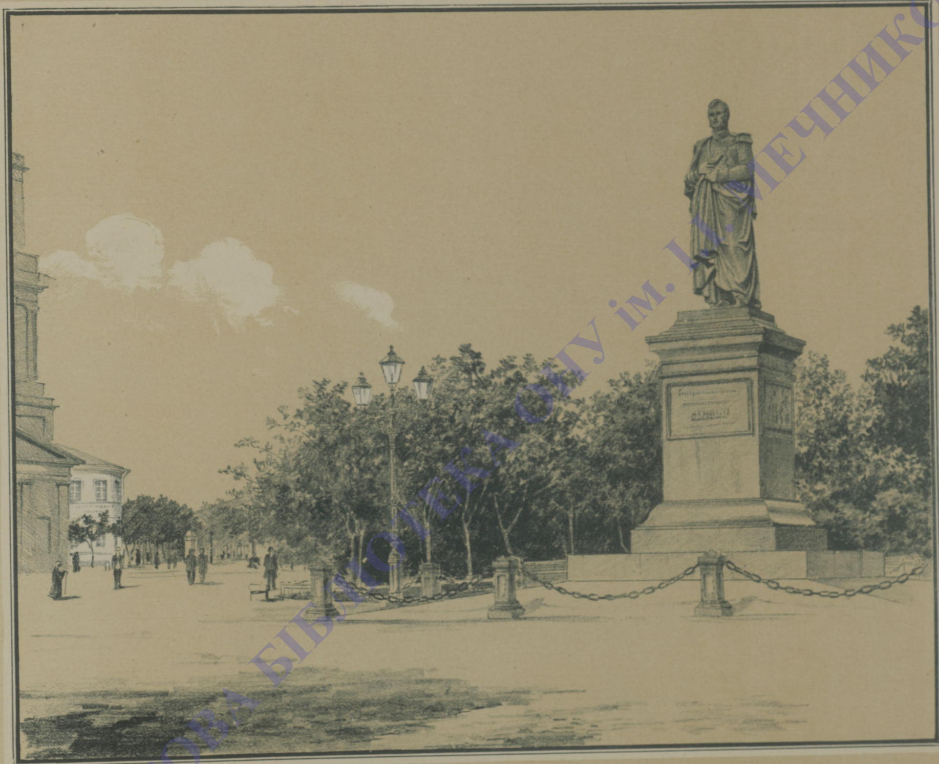
СОБОРНАЯ ПЛОЩАДЬ. (Памятникъ князю Воронцову).