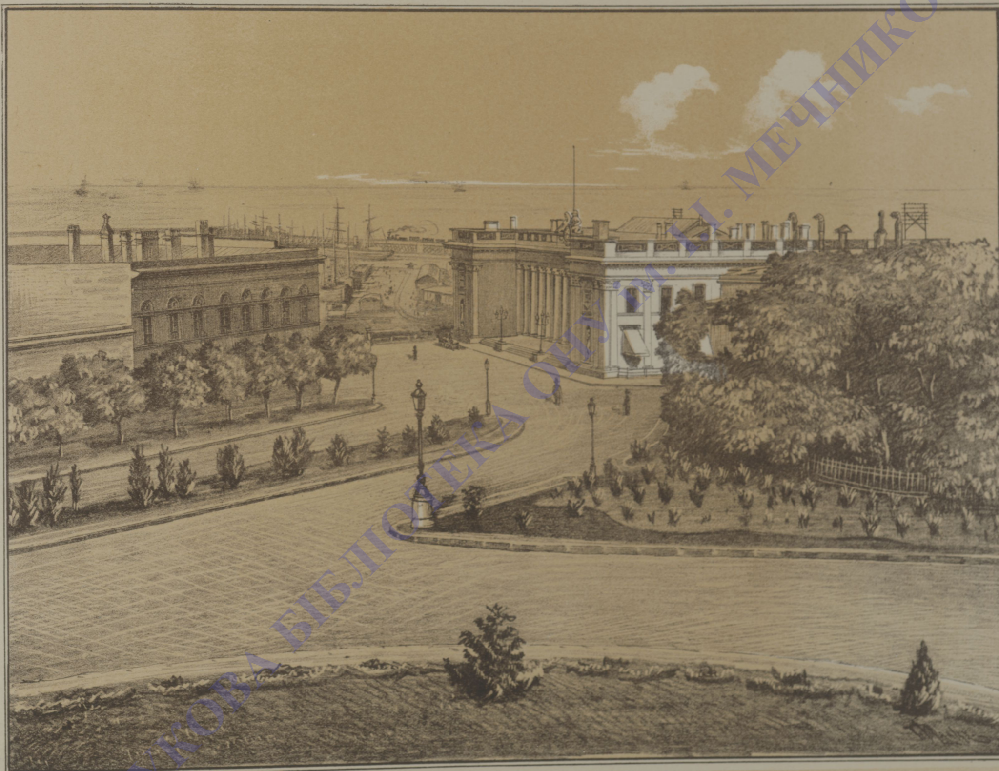
Городская Дума со стороны театральной площади.