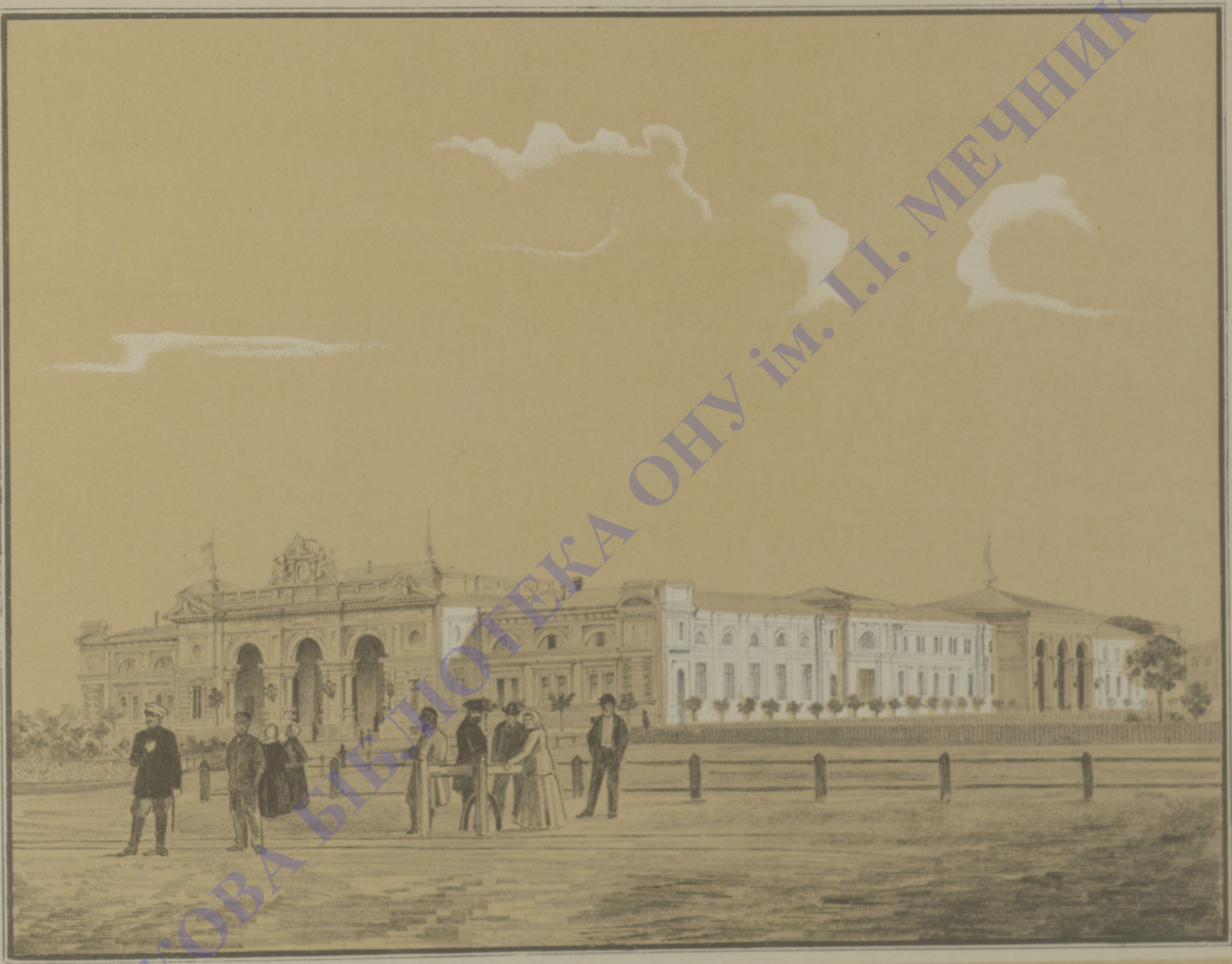
ВОКЗАЛЬ ЖЕЛѢЗНОЙ ДОРОГИ.