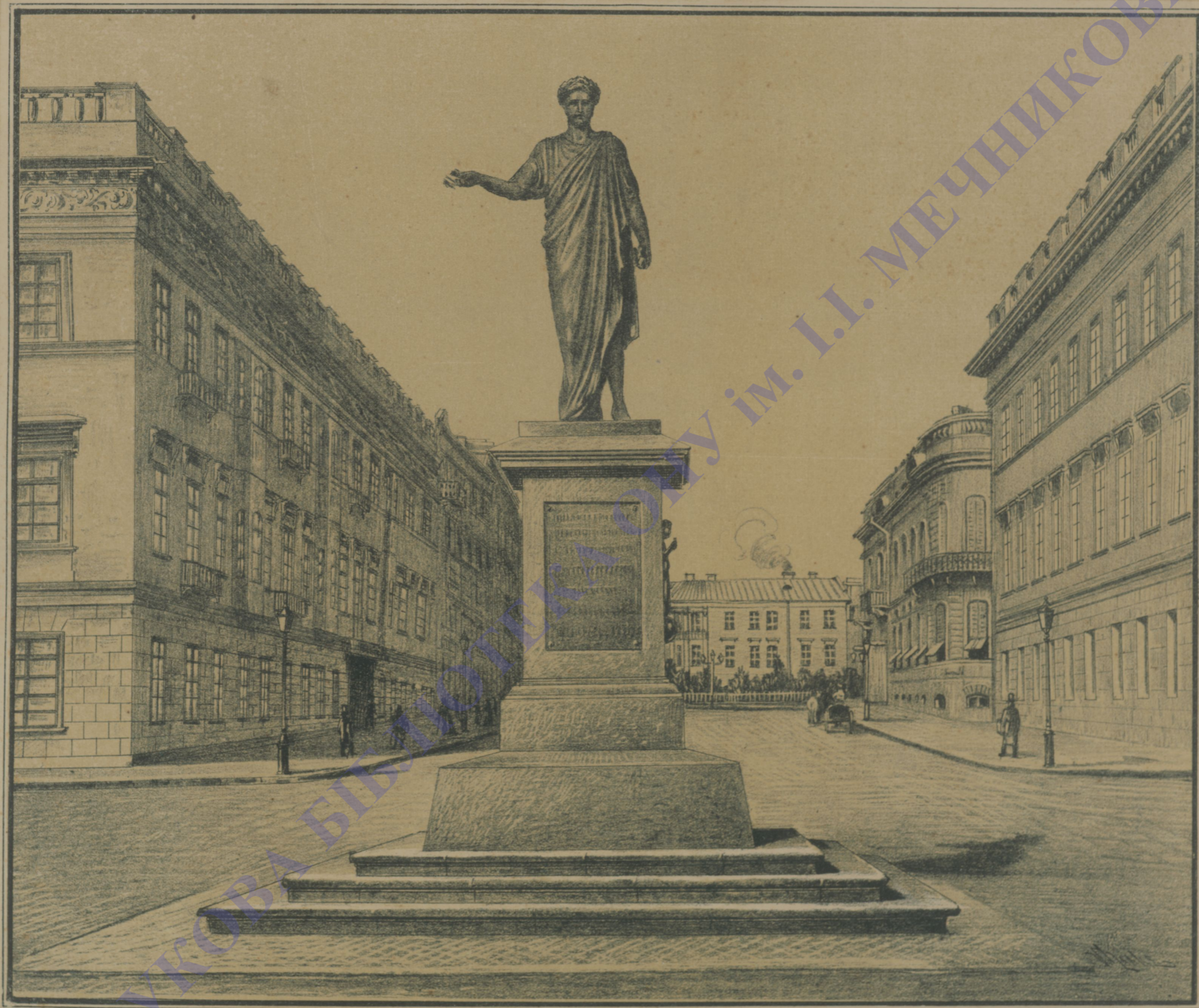
НИКОЛАЕВСКІЙ БУЛЬВАРЪ. (Памятникъ Герцогу Ришелье).