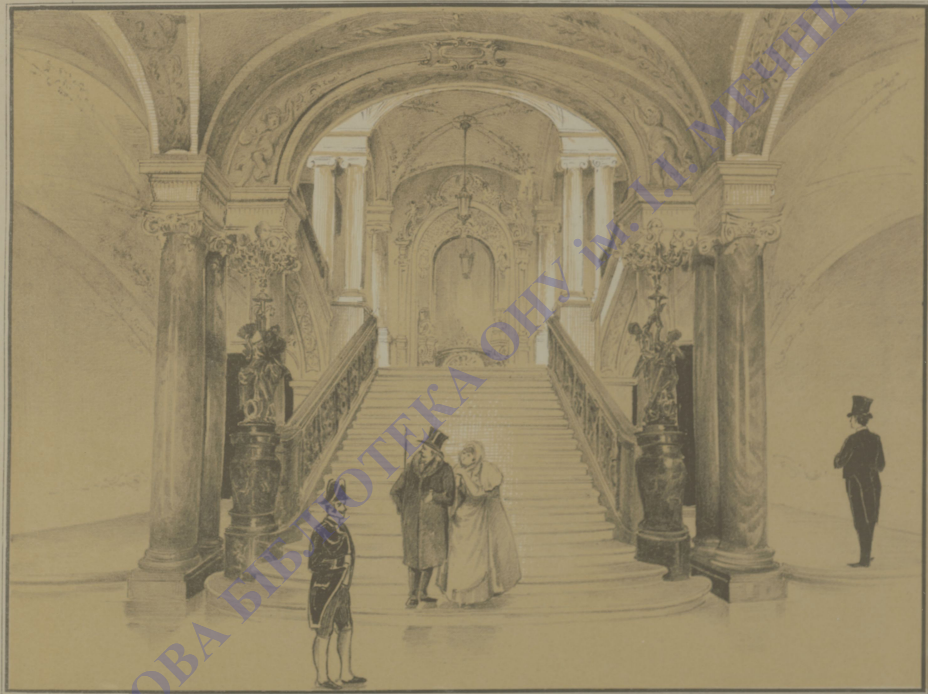
ПАРАДНАЯ ЛЪСТНИЦА. * L'ESCALIER DE PARADE.