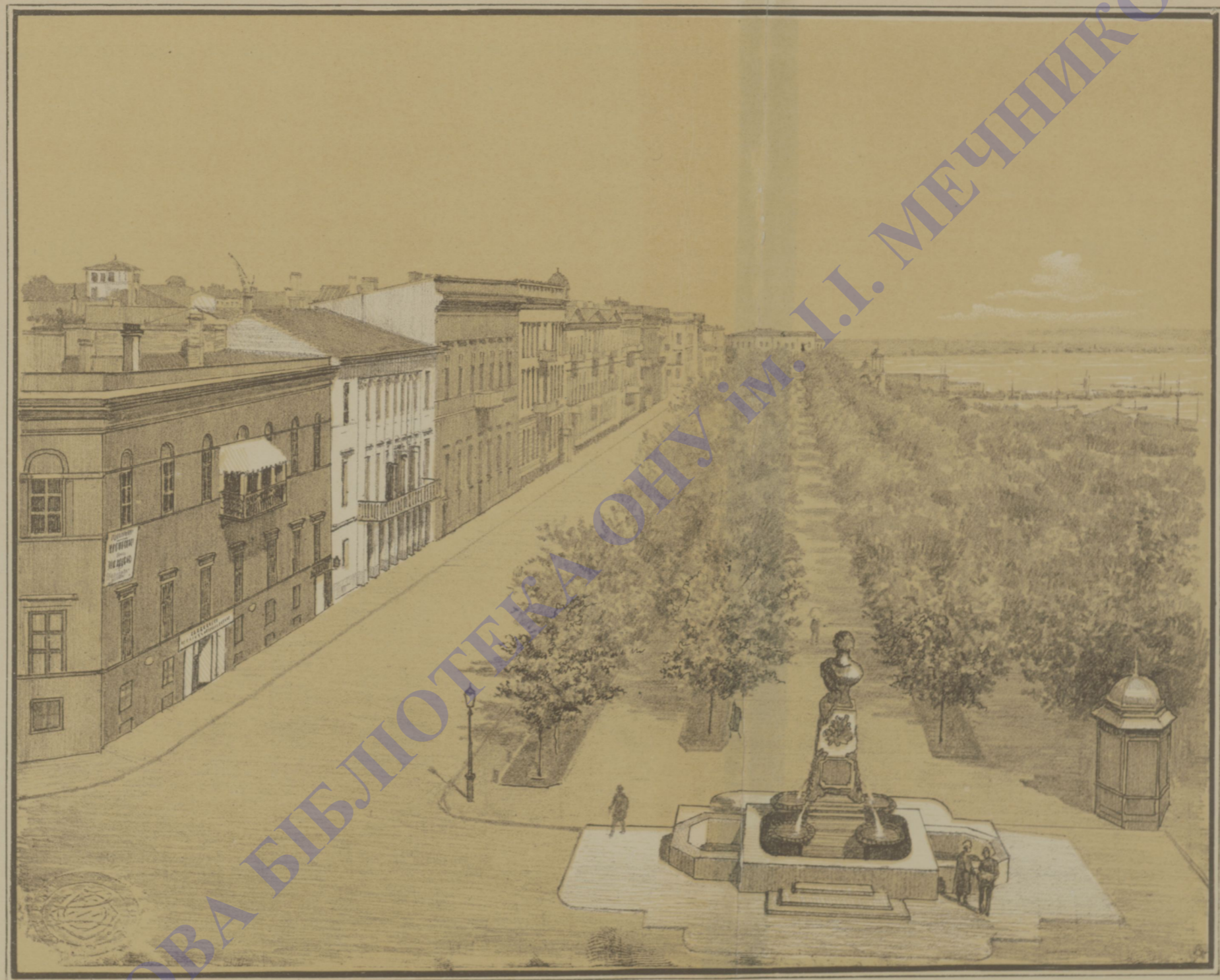
БУЛЬВАРЪ СО СТОРОНЫ ГОРОДСКОЙ ДУМЫ