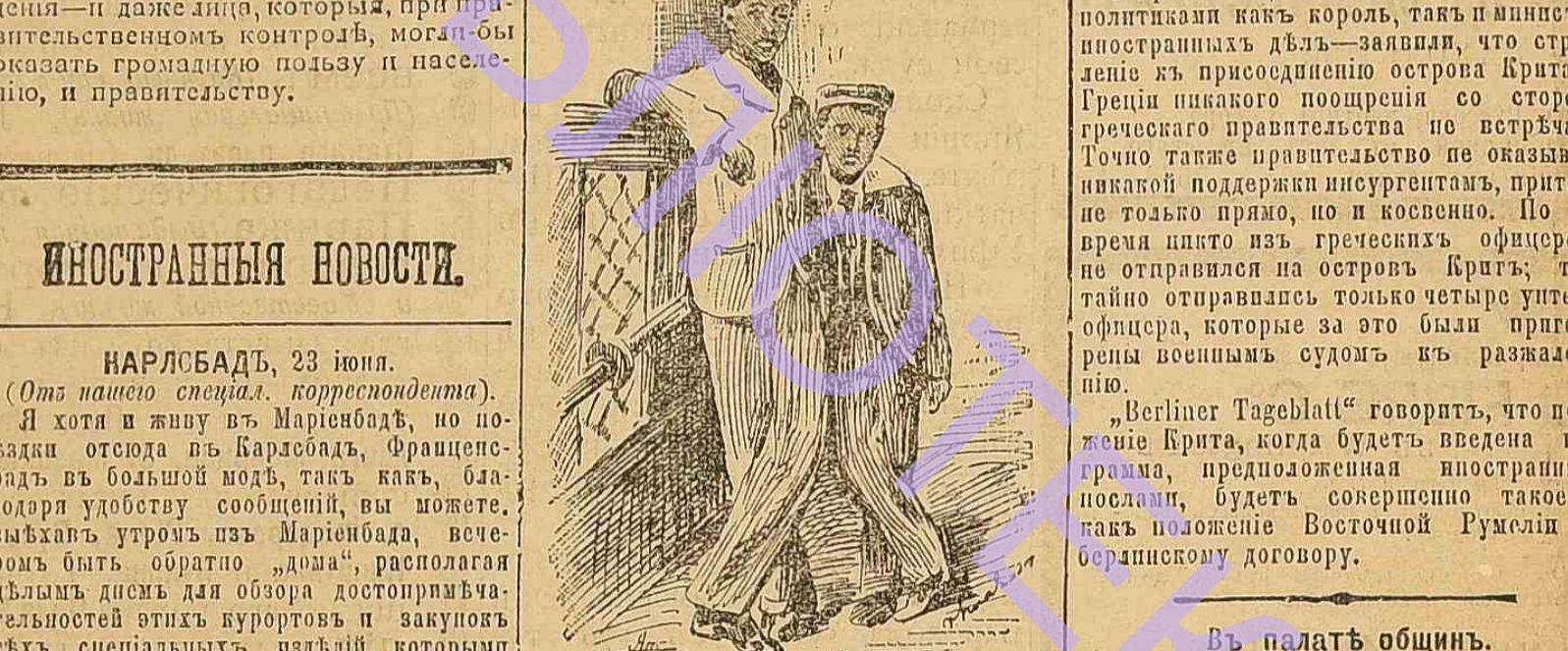
Принцы Бель и Вибханду