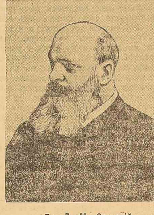
Г. Д. М. Сольский.