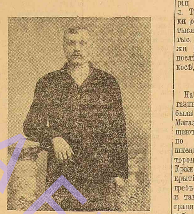
Вакхониш Кочерга Скоростью.

Театр и музыка. В воскресенье в одном из магазинов произошла кража.