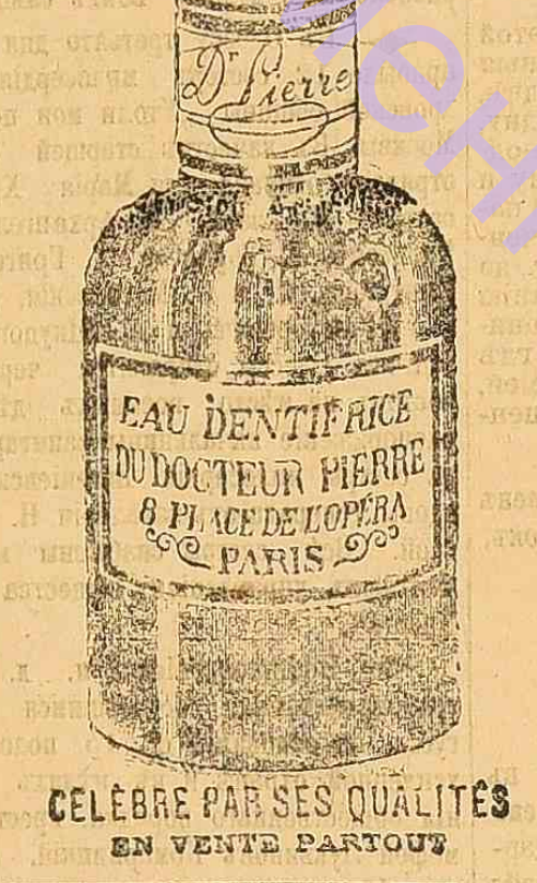
CELEBRE PAR SES QUALITES EN VENTE PARTOUT