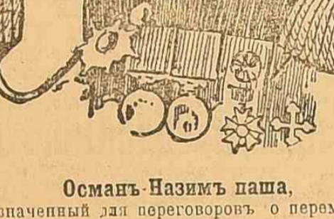
Осман Назим паша, назначенный на переговоры о перемирии.