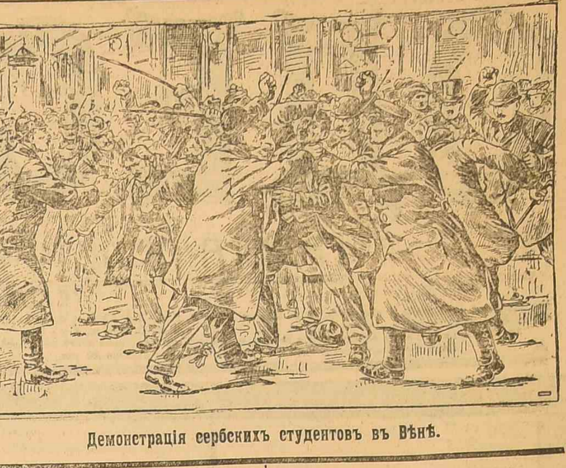
Демонстрация сербских студентов в Вьне.