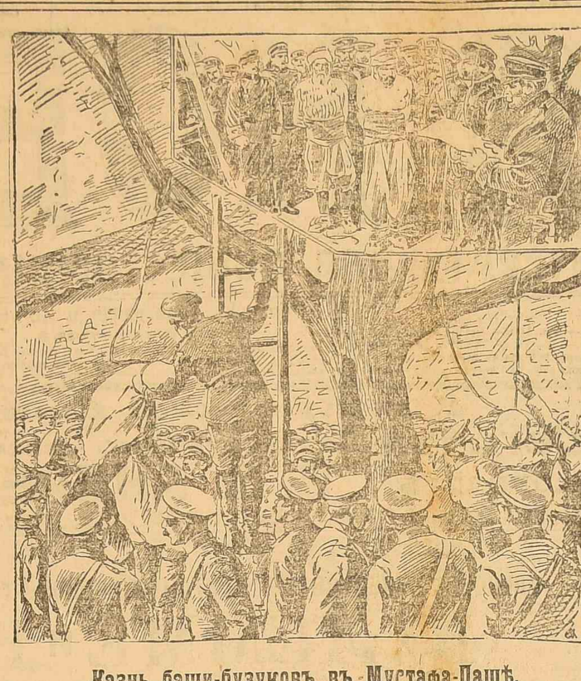
Казнь баши-бузуков в Мустафа-Паш.