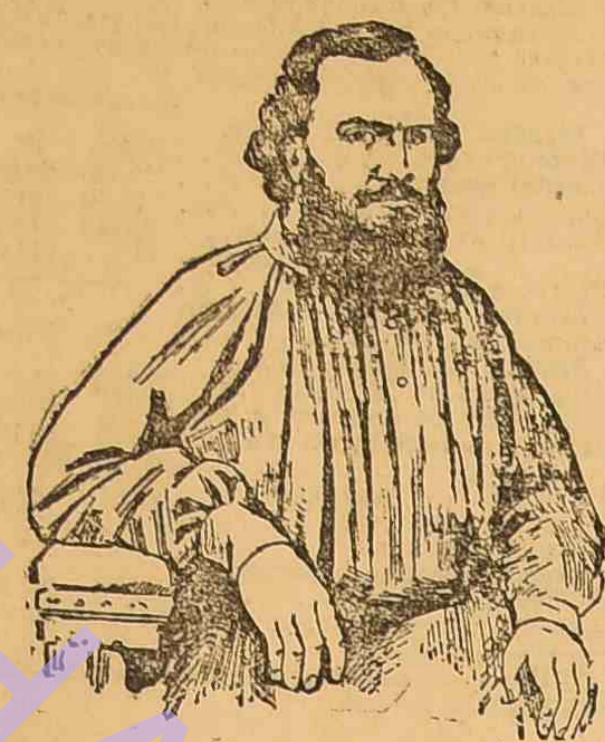
Л. Н. Толстой.

Къ 50-лѣтню со дня оварды Л. Н. Толстого.