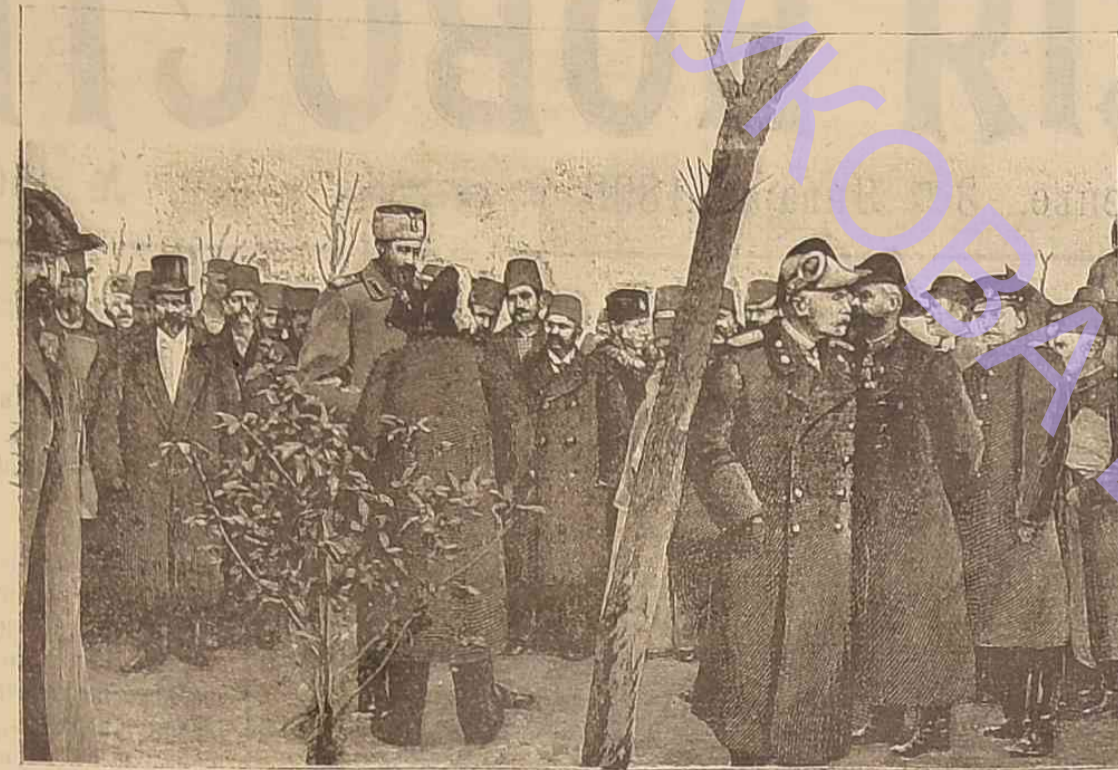
Санъ Стефано.—Великій Князь Николай Николаевичъ на открытіи памятника русскимъ воинамъ.

могетъ моря, а потомъ...—я должна сказать тебѣ это...—всѣ мужья одарены однимъ общимъ недостаткомъ, а именно: они ненавидятъ все то, что любятъ ихъ жены. Сколько разъ между нами происходили споры, хотя бы напимѣрь изъ-за музыки Бетховена. И споры эти были часто очень ожесточенные. Ты хорошо знаешь: мужъ мой флегматикъ, а же—женщина необыкновенно нервная!