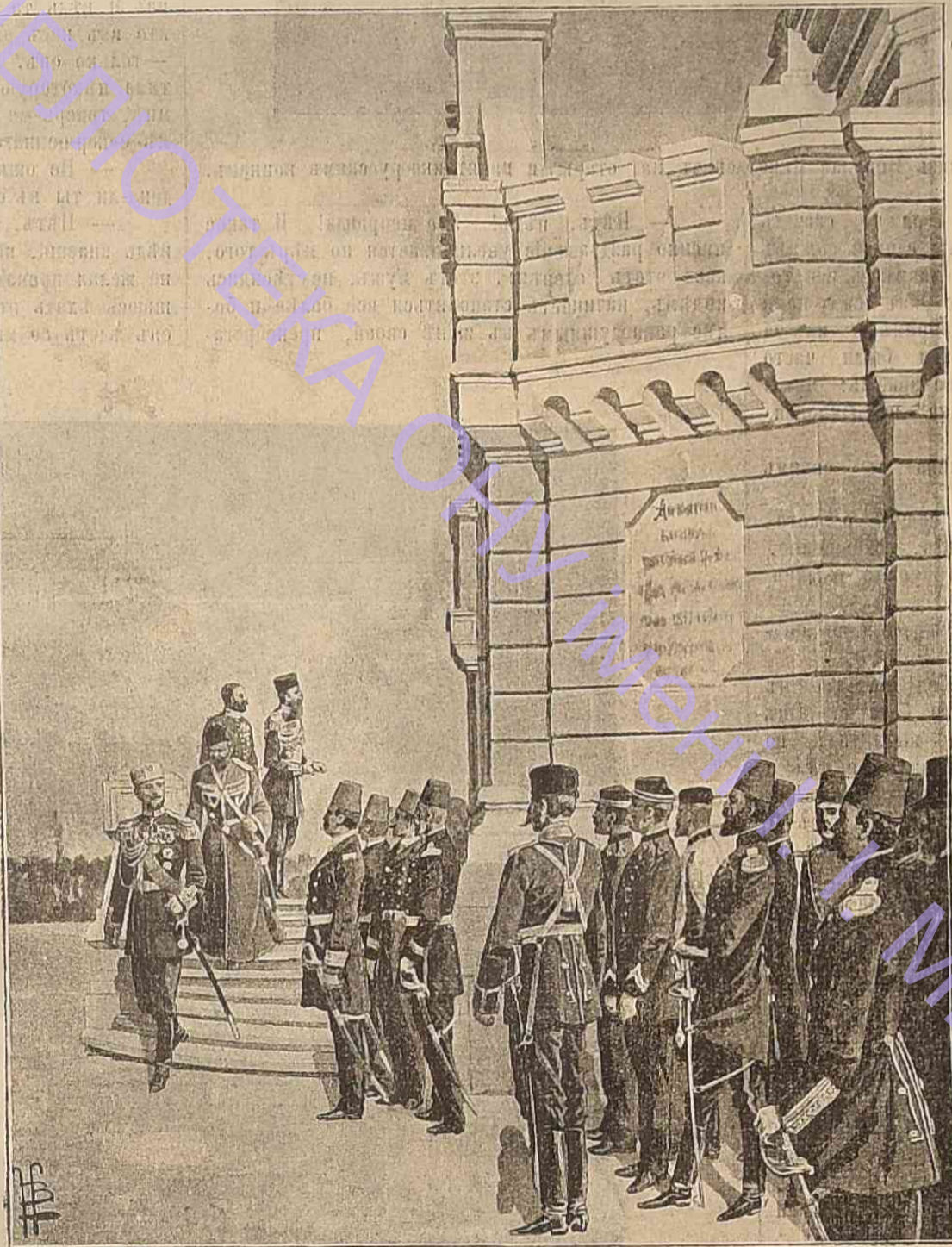
Санъ-Стефано. — Открытіе памятника русскимъ воинамъ, павшимъ въ русско-турецкую войну 1877—1878 гг.

— Съ мужемъ! Ничего подобнаго мнѣ даже и не слось! Прежде всего Луиджіо терпѣть не